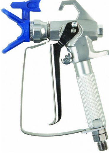
S500 Havasız Sistem Boya El Tabancası S500 Airless System Paint Hand Gun